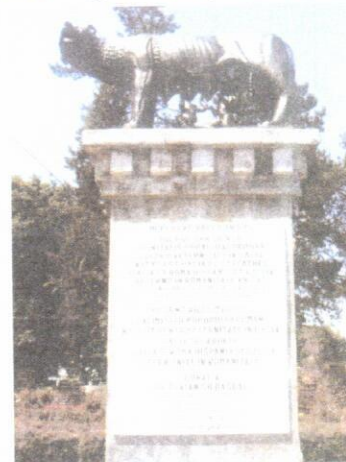
(2005-Lupa Capitolina la Năsăud)